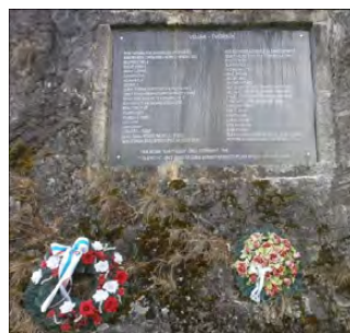
• Pamätník vojakom-tvorníkom pod Skalkou nie je zabudnutý.

Starší Petrania sa na výraz vojak - tvorník ešte pamätajú, mladším len upresníme, že pracovné tábory MNO boli nástrojom, ktorým jeho predstaviteľia rie-