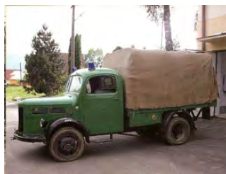
• Na Pragu ARO - 150 si môžu spomenúť len pamätníci.

bytky. Na ich podporu sa potom niekoľko rokov konala aj verejná zbierka. Horelo tiež v roku 1789. Tesne pred kosbou požiar zničil päť domov. Nový požiar v roku 1790 zapríčinený bleskom zničil aj posledné zvyšky ich majetku. Spomína sa aj požiar z roku 1830, ktorý vzbĺkol neďaleko dreveného hostinca, pri ktorom, stála obecná zvonica (v parku pred kultúrnym domom). Pretože už napadol sneh podarilo sa ju rýchlo uhasiť. Veľký požiar sa spomína aj v roku 1875. Vypukol uprostred obce, u Začkov, pri dnešnej zvonici a rozšíril sa na obidve stany. Keďže muži boli roztrúsení po svete za prácou, za obeť mu padla skoro celá dedina. Táto situácia sa zopakovala aj 3. augusta 1905. Oheň vypukol vo vtedajšej pastierni, odkiaľ ho silný vietor rýchlo rozniesol po dedine. Popolom ľahlo 50 domov. Chlapi boli na múračkách a problémom sa ukázal aj nedostatok vody. Na pomoc dedine sa vybrali Vavrišovčania,