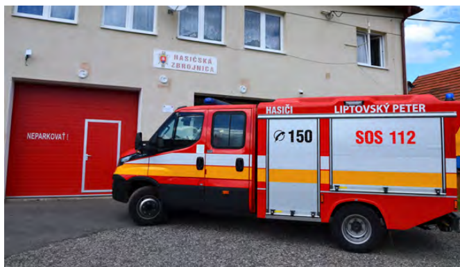
• Nablýskané IVECO našich hasičov je vždy v plnej pohotovosti