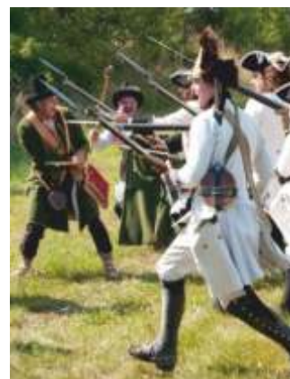
• Cisárske vojská „utrpli“ víťazstvo v prehratej bitke.

čil. Jeho osobný pobyt v Liptovskom Petre zaznamenali dve listiny z 15. a 17. augusta 1399.