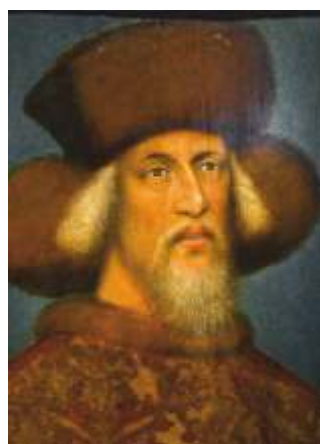
• Žigmund Luxemburský

Tretí uhorský kráľ Žigmund Luxemburský (1387–1437), ktorý bol zároveň aj rímskym cisárom, Liptovský Peter už priamo navštívil. Samozrejme, nie zo zvedavosti, ale zo štátnickej nutnosti. Totiž v roku 1397 Liptov obsadili spojenci neapolského kráľa Ladislava Anjou na čele s moravským markgrófom Prokopom a poľským kniežaťom Ladislavom, ktorí sa zmocnili všetkých troch liptovských hradov. Keďže v tom čase bol Žigmund zanepázdnený vojnou s Turkami (pri Nikopole), do Liptova prišiel až roku 1399. Hrad veľmi rýchlo dostal späť a cudzie vojská z krajiny vytla-