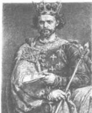
• Eudovít I.

Počas 730. výročia prvej písomnej zmienky o obci si pripomenieme troch uhorských panovníkov a povstanie Františka Rákocziho, vojaci ktorého sa v roku 1709 stretli pri našej obci s rakúskym cisárskym vojskom v bitke známej ako švihrovská.