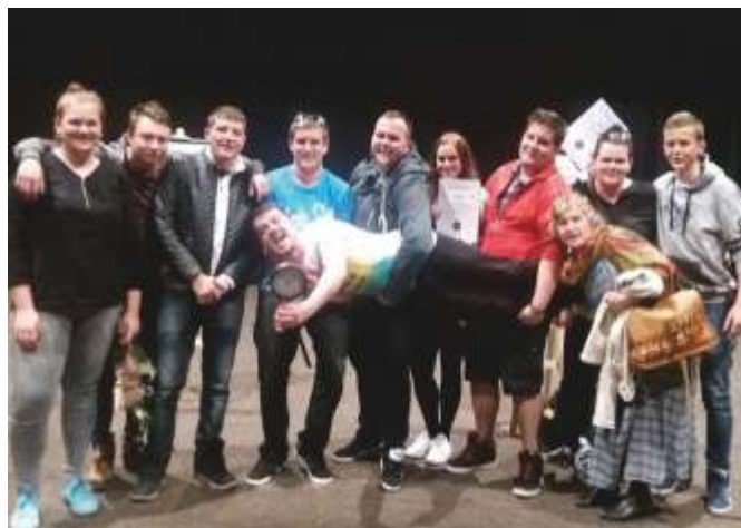
• Členovia Divadelného súboru f*ACTOR z Liptovského Petra. Z ich raketového štartu máme radosť aj my.