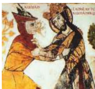
• Ladislav IV. Kumánsky

V nedeľu 18. septembra budú obecnému výročiu v evanjelickom kostole venované Služby božie.