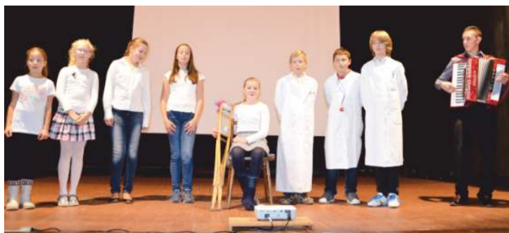
• V kultúrnom programe sa predstavila petranská mladá.