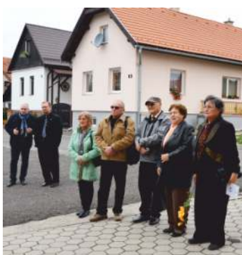
• Účastníci spomienkového stretnutia pred kultúrnym domom.