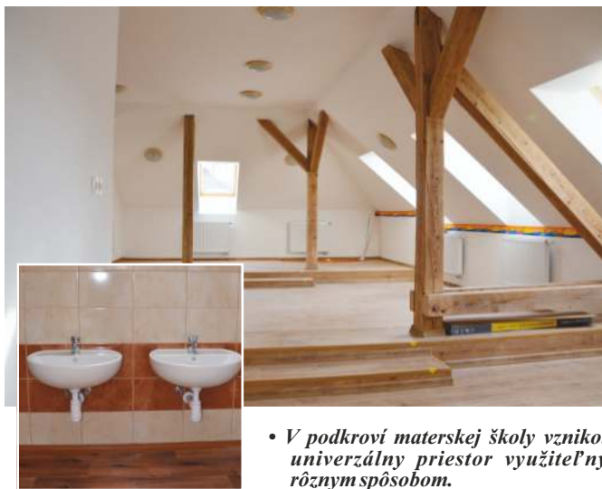
• V podkroví materskej školy vznikol univerzálny priestor využiteľný rôznym spôsobom.

Zároveň je v novej lokalite naplánovaný objekt občianskej vybavenosti, ktorý bude slúžiť aj domácim občanom.