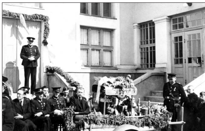
• Slávnostný krst novej motorovej striekačky za obecným domom niekedy v roku 1934.