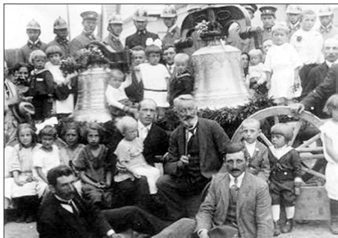
• Dovezenie dvoch nových zvonov do L. Petra v roku 1926 z firmy Bratia Fischer v Trnave, v pozadí miestni hasiči.

Presný dátum sa síce nezachoval, ale bolo to v roku 1921, keď sa petranskí hasiči opäť zorganizovali. Bol to však