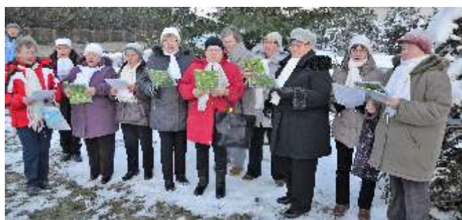
• Spevokol peterských žien nesmie chýbať pri rozsvietení stromčeka a začatí adventu